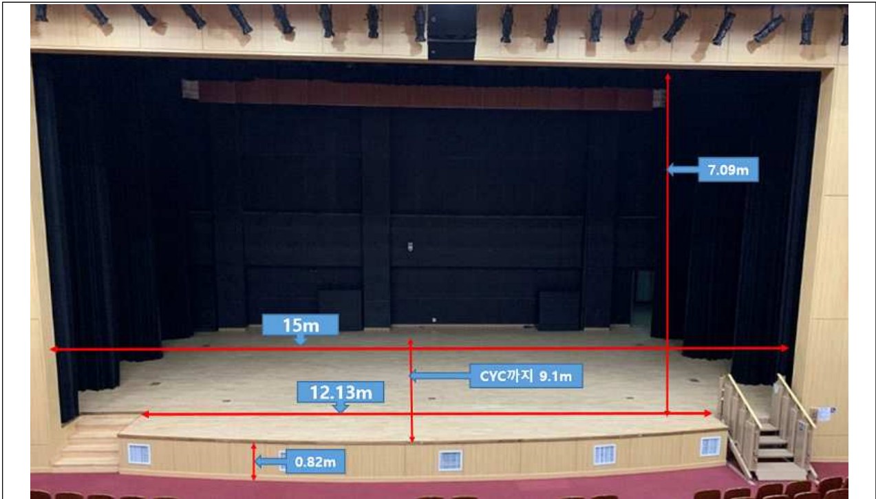
◎ 무대 및 객석(수치 표시)